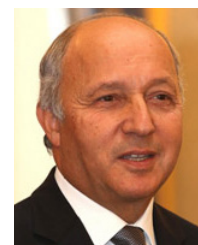
Laurent Fabius, ministre français des affaires étrangères.

* rappellera que le droit international relatif aux droits de l'homme protège les individus et non une religion ou une conviction en tant que telle. La protection d'une religion ou d'une conviction ne peut être invoquée pour justifier ou excuser une restriction ou une violation d'un droit de l'homme exercé par une personne individuellement ou en commun. » ■