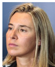
Federica Mogherini, Haute représentante de l'Union pour les affaires étrangères et la politique de sécurité.

Les ministres des affaires étrangères de l'Union européenne ont adopté le 24 juin 2013 un texte qui définit les principes devant guider l'UE « face à des menaces de violence, à des actes de violence ou à des restrictions imposées du fait de l'expression d'opinions sur une religion ou une conviction ». Voici ce texte.